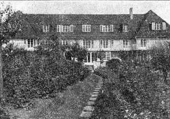
Le «Lindenholz», maison pour femmes seules professionnellement occupées, construite à Zurich, par l'architecte Lux Guyer. Bâle, Lucerne, Winterthur possèdent aussi des maisons analogues.