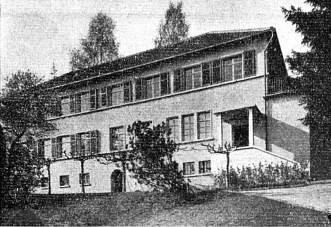
La crèche modèle de Horgen, affiliée avec 61 autres institutions analogues, fondées et dirigées uniquement par des femmes, à l'Association suisse des crèches.