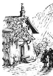
Une gravure sur bois de «Bourg d'en haut»

Heureux instants d'oubli du présent, de souvenirs du cher Salève. Quel Genevois y resterait insensible?... PENNELLO.