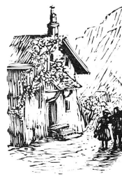
Une gravure sur bois de «Bourg d'en haut»

Mais, cette fois, il y a un texte qui accompa-