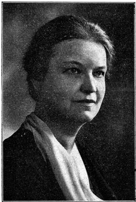
Cliché Mouvement Féministe

1 Nos lectrices n'ont pas oublié les démarches faites à ce sujet l'an dernier par les féministes neuchâteloises et qui avaient été couronnées du plus complet insuccès! Il y a décidément progrès. (Rééd.)