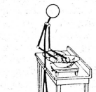
Surveillez-la donc avec un tabouret !