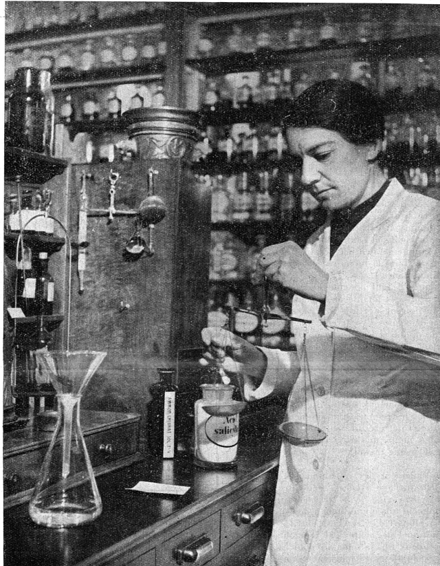
Cliché «Dù Schweizer Frau».

Ceux de nos lecteurs et lectrices qui ne conservent pas la collection du «Mouvement», et ils sont certainement nombreux, voudraient-ils nous rendre le service de retourner à l'adresse de notre Rédaction, Crêts-de-Pregny, Genève, le dernier numéro, paru avant celui-ci, soit celui du 10 juillet 1943, N° 643, le tirage s'en étant trouvé tout à coup insuffisant? Merci d'avance à tous.