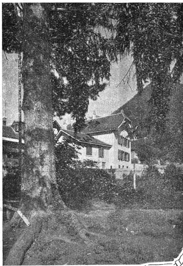
Cliche „Maison de vacances“

Mlle Antoinette Cossy, décédée à Lausanne en 1939, a légué à l'Etat de Vaud sa maison d'Ollon, affectée aux vacances de femmes vaudoises fatiguées, spécialement des mères de famille ou des jeunes filles ayant besoin de repos. Cette char-