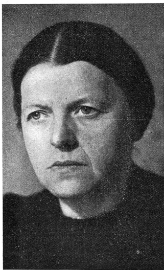
Cliché Mouvement Féministe.

Au sortir du défilé du Morgarten, j'ai enfourché ma bicyclette et pris la grand'route qui monte vers Biberbrück. Elle suit, en la dominant d'assez haut, la vallée de la Biber. Plus je m'élevais, plus j'avancais sur le plateau — le champ de bataille de Rothenturm — et plus l'impression me gagnait de traverser une contrée familière. Ces vastes pâturages ondulants, déjà jaunés par l'automne, ces maisons éparées, isolées, ces toits de tuiles rouges... Au loin, ces horizons bleuissants; au près, ces tourbières qui s'étendent des deux côtés du chemin et dont les petits tas de tourbe mise à sécher ressemblent à des gnomes accroupis... Ces camions chargés de combustible que je croise sans cesse... Suisse donc à la Brévine ou aux Ponts? Dans quelque vallée de mon Jura neuchâtelois? — Mais non. Je suis dans le canton de Schwyz, sur ce haut plateau solitaire, sans cesse balayé par les vents, où le thermomètre, l'hiver, descend plus bas encore qu'à la Bré-