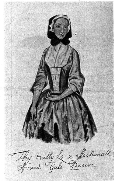
Cliché Editions Labor et Fides, Genève.