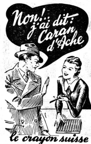
Le crayon suisse

Les grands chefs militaires russes de sexe faible sont d'abord la générale Tamara Kassaninova,