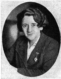
Cliché Mouvement Féministe Ellen WILKINSON Ministre de l'Éducation

de la gauche, vingt et une de ces parlementaires sont travaillistes; une est conservatrice (Lady Davidson), une libérale (Miss Megan Lloyd George, la seule et unique femme députée que le Pays de Galles, qui paraît plutôt réfractaire au féminisme, ait jamais comptée jusqu'à présent, et dont la grande popularité est bien connue); et une indépendante (Miss Eleanor Rathbone, la protagoniste des allocations familiales que nous avons bien souvent vue dans nos Congrès comme à la S. d. N. à Genève). Toutes trois ont déjà exercé aux Communes un mandat plus ou moins long, alors que bien des noms dont nous avons reçu de Londres la liste complète sont entièrement inconnus dans les milieux féministes: espérons que ces nouvelles recrues parlementaires se révéleront, à leur tour, des convaincues, à l'exemple de Lady Noel-Buxton et de Dr. Edith Summerskill, qui a toujours fait œuvre féministe utile, dans la précédente Chambre. D'ailleurs cette tendance au renouvellement des Parlements se retrouve un peu partout, et se justifie pleinement — à condition toutefois bien entendu que ne se perde pas l'expérience acquise pour notre cause.