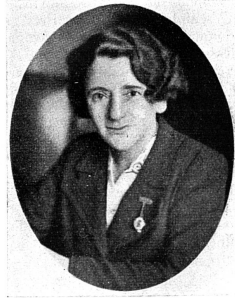
Cliché Mouvement Féministe. Ellen WILKINSON Nouvellement nommée «Membre du Conseil Privé» de Grande-Bretagne.

Cette femme éminente a dû batailler toute sa vie. Fille d'un ouvrier dans les filatures de coton de Manchester, Ellen gagna une bourse à l'Université de sa ville natale; elle poursuivit ses études et obtint le grade de Maître ès Arts juste avant l'autre guerre. Elle se voua avec enthousiasme à la cause du suffrage féminin et, lors de la scission qui se fit dans les rangs des suf-