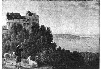
Château de Salenstein

On voit que les buts à atteindre ne manquent pas, que chacun de ces services nécessite des efforts suivis et coûteux. Ne refusez pas votre appui à cette œuvre utile.