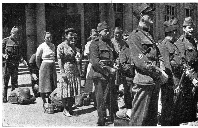
Services complémentaires féminins Des S. C. F. sont démobilisées en même temps que la troupe Ce cliché paru dans notre journal en juillet 1941 reprend de l'actualité.

Quant à l'accès aux hautes fonctions publiques, il importe de faire une distinction nette entre la notion d'éligibilité et celle de candidature. Si une loi sur l'égalité des droits civiques venait à passer, nous deviendrions