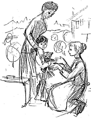
Dessin de Rose-Marie Joray

Je me dirige vers la pouponnière, un modèle du genre. Tout reluit, tout est discrètement coloré, gai, précis, attirant. Je crois même que j'y laisserais Marc sans inquiétude, moi qui avais juré le contraire... seulement il n'y a jamais un lit de vide à la Pouponnière. Elle a un succès énorme et il faut s'inscrire à l'avance pour pouvoir y déposer son bébé.