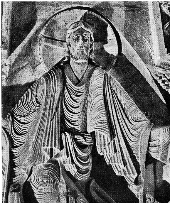
LE CHRIST DU TYMPAN DE VEZELAY