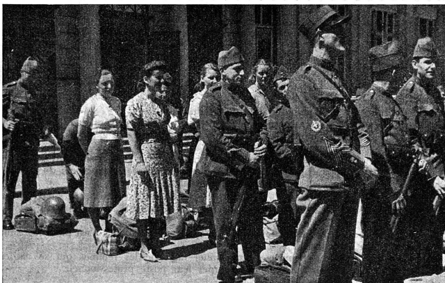
Equipe de cuisinières licenciée en même temps que la troupe en 1940. C'est un document rare : ces SCF n'ont pas encore d'uniforme

Le Conseil fédéral a reconnu la nécessité de la participation des femmes à notre défense nationale, et se fonde sur les expériences faites pendant le service actif de 1939-1945. Il a fixé l'organisation de la plus jeune formation de notre armée par l'ordonnance du 12 novembre 1948.