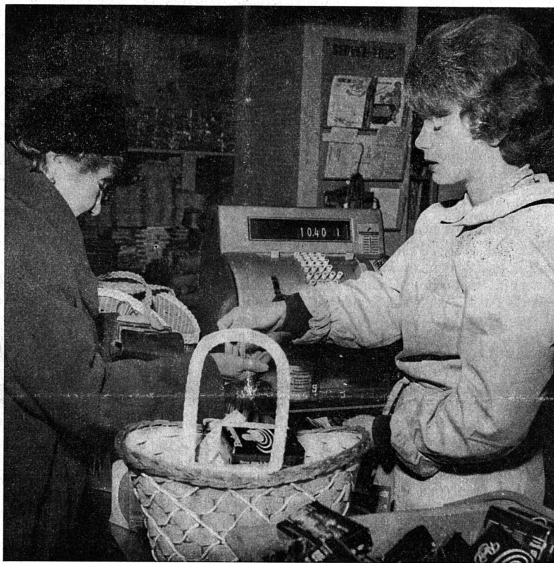
Les femmes représentent le 29% de l'ensemble de la main-d'œuvre, en Suisse.