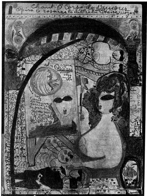
Une des peintures d'«Alyose» exposée à Lausanne avec les œuvres des femmes peintres, sculpteurs et décorateurs.