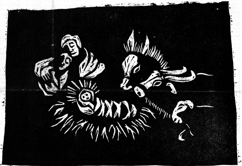
Bois gravé de Ruth Steinegger