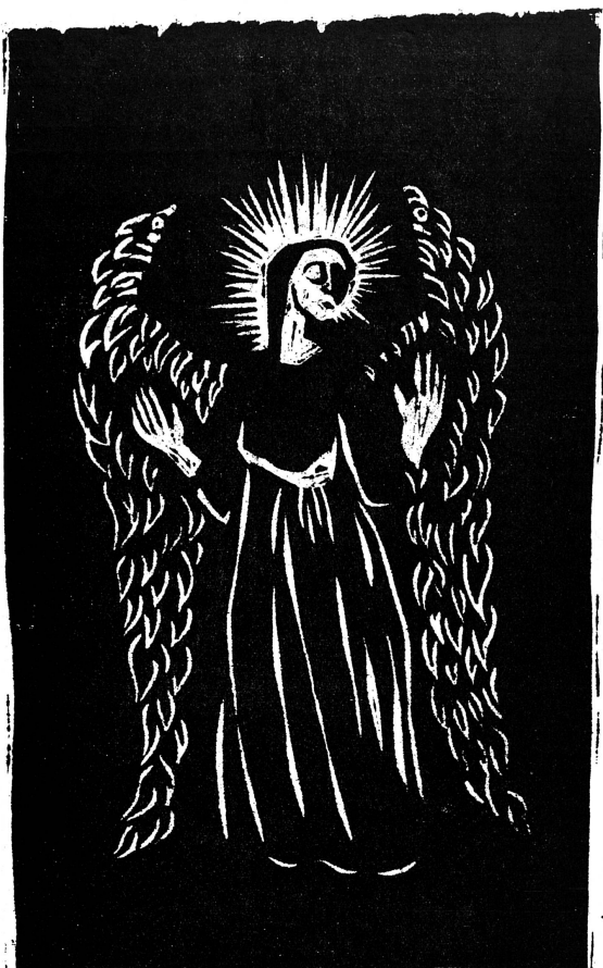
Bois gravé de Ruth Stelnegger

Je vous annonce une bonne nouvelle qui sera pour tout le peuple le sujet d'une grande joie. »