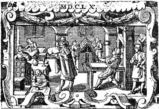
Intérieur d'imprimerie pris dans un livre du XVII e siècle. On voit représenté tout le personnel nécessaire ; les deux compositeurs n'ont pas de copie sous les yeux, mais composent sous la dictée d'un lecteur, ou agnoste, installé au fond à droite, qui déchiffre le manuscrit. (D'après l'interprétation du bibliographe Madden).

LA GLORIEUSE ÉPOQUE DE GRANDS IMPRIMEURS-ÉDITEURS