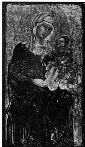
Barnaba da Modena: « La Vierge et l'Enfant »