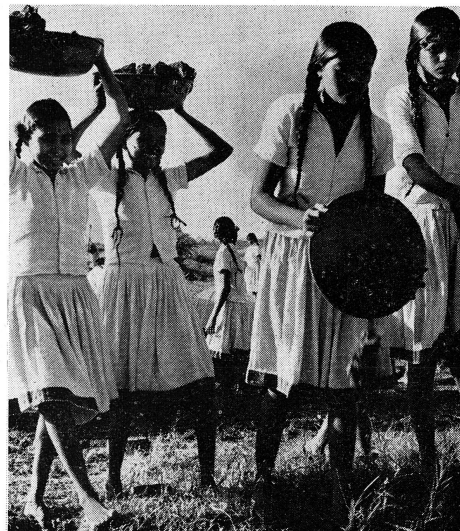
Ces jeunes Indiennes du Mahdi prêtent la main à la construction d'une école secondaire d'agriculture, travail financé en partie par l'Aide suisse à l'étranger. Elles recevront là une formation qui les inspirera dans l'organisation de leur existence familiale, et aussi dans l'amélioration de la vie au village.