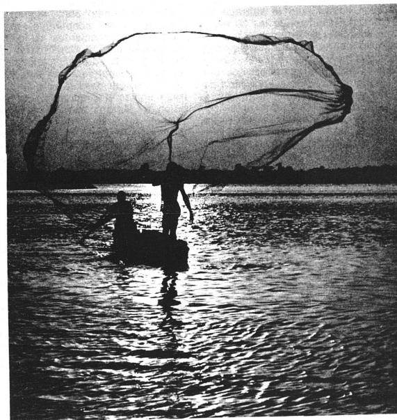
qui centre actuellement son action sur l'Inde et le Tchad. C.C.P. Lausanne 10 - 1533.

Etre toujours prêt à jouir de la beauté du monde et des choses