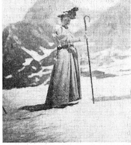
Et pourtant !