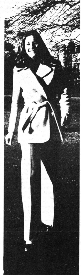
Des horizons plus vastes.