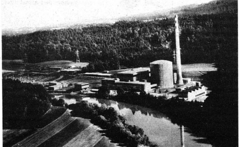
Les trois centrales nucléaires suisses (Bznau I et II, Mühleberg) couvrent environ 20% de la consommation d'électricité du pays. Cette photo montre la centrale de Mühleberg, sise à 14 km en aval de Berne, au bord de l'Aar.

« Alors que, dans le cas de l'énergie nucléaire les dangers sont très petits si les précautions nécessaires sont prises, l'émission de gaz carbonique provoquée par la production conventionnelle d'énergie signifie une modification des radiations terrestres, qui se renforce lentement mais irréversiblement, et aux suites de laquelle nous et les générations futures sommes totalement livrés. Il ne s'agit pas d'élever la peur d'un accident de centrale nucléaire ou de déchets radioactifs par le spectre d'une catastrophe climatique. Il faut cependant faire voir l'importance relative des problèmes. L'humanité n'est exposée qu'à un danger supplémentaire minime par l'introduction de l'énergie nucléaire; mais elle obtient la possibilité de se débarrasser de vraies menaces ».