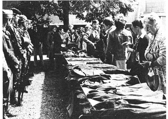
La mode automne-hiver à l'armée!