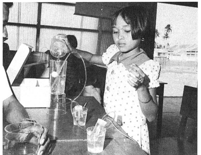
La participation des enfants à leur année : tout est possible.