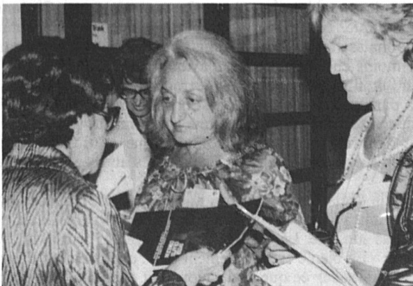
Betty Friedan (au centre)

Les « femmes libres ukrainiennes » faisaient une triste grève de la faim sous une banderole qui n'intéressait guère, mais le