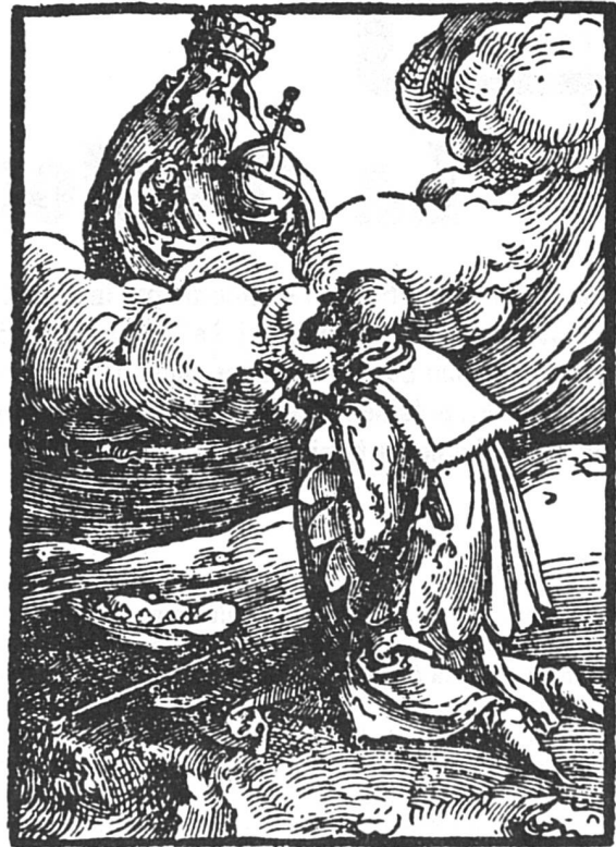
Gravures de Lucus van Leyden, XVI e siècle.