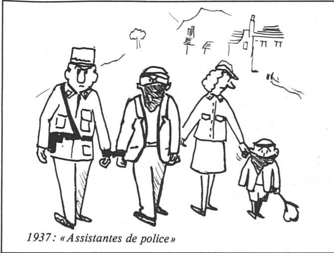
1937: « Assistentes de police »

Plantons, rondes, patrouilles, accidents, écoles, voilà, en résumé, la vie des femmes de la Brigade des agentes de la circulation (BAC). A Genève, elles sont 44, c'est-à-dire 7% d'un corps de 608 hommes. A elles seules, elles monopolisent tous les piédestals de la ville d'où elles règlent la circulation, activité maintenant exclusivement féminine. Certes, elles encadrent les jeunes gendarmes qui sont en école de formation, mais c'est uniquement « pour le cas où ils devraient régler la circulation », ce qui