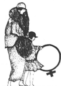
L'enfant au cerceau (42 x 61)