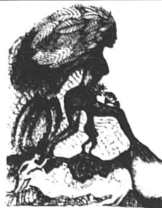
La femme au feuillage (42 x 61)