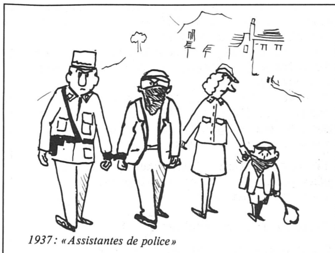
1937: « Assistentes de police »

Plantons, rondes, patrouilles, accidents, écoles, voilà, en résumé, la vie des femmes de la Brigade des agentes de la circulation (BAC). A Genève, elles sont 44, c'est-à-dire 7% d'un corps de 608 hommes. A elles seules, elles monopolisent tous les piédestals de la ville d'où elles règlent la circulation, activité maintenant exclusivement féminine. Certes, elles encadrent les jeunes gendarmes qui sont en école de formation, mais c'est uniquement « pour le cas où ils devraient régler la circulation », ce qui