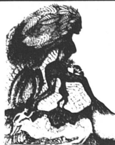
La femme au feuillage (42 x 61)