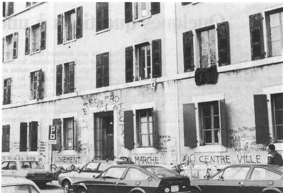
Immeuble «occupé» à Genève. Sur la façade: «Nous occupons pour un logement bon marché au centre-ville»

Puisque l'on peut aujourd'hui prévoir avec suffisamment d'exactitude la demande de logement en 1985, voire en 1990, l'on sait, toujours dans le cas de Genève, qu'il faudra, selon toute vraisemblance, 11 000 logements de plus d'ici deux ans. Mais si les autorités cantonales savent bien qui voudra quoi (en nombre de pièces), en 1990, elles ne savent ni où (banlieue ou centre ville), ni comment (grands ensembles ou petits immeubles locatifs, voire villas), bref, elles ne connaissent rien des atti-