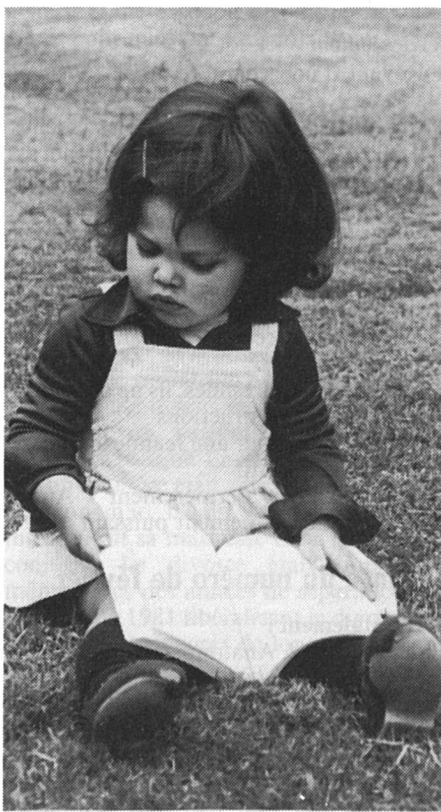
Pour la deuxième génération (enfants nés et élevés en Suisse) les valeurs de deux cultures s'opposent dès l'enfance.

Elle cumulera donc ses deux rôles, dissimulant son surmenage par « respect des traditions », au risque de tomber physiquement ou nerveusement malade. Pourtant, ces conditions, toutes draconiennes qu'elles soient, lui donnent la possibilité « légale » de sortir de chez elle, d'avoir des contacts sociaux, ce qui n'est pas le cas, on l'a assez dit, de la ménagère, dont l'intégration et l'adaptation en Suisse sont rendues beaucoup plus difficiles à cause du sentiment d'abandon et d'isolement qu'elle éprouve.