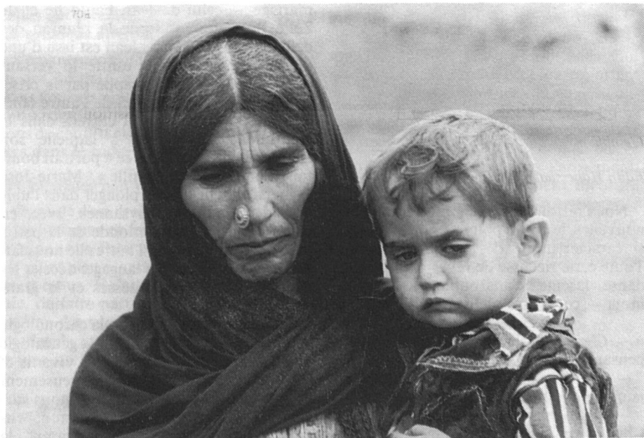
Réfugiés afghans, village de réfugiés de Nasirbagh