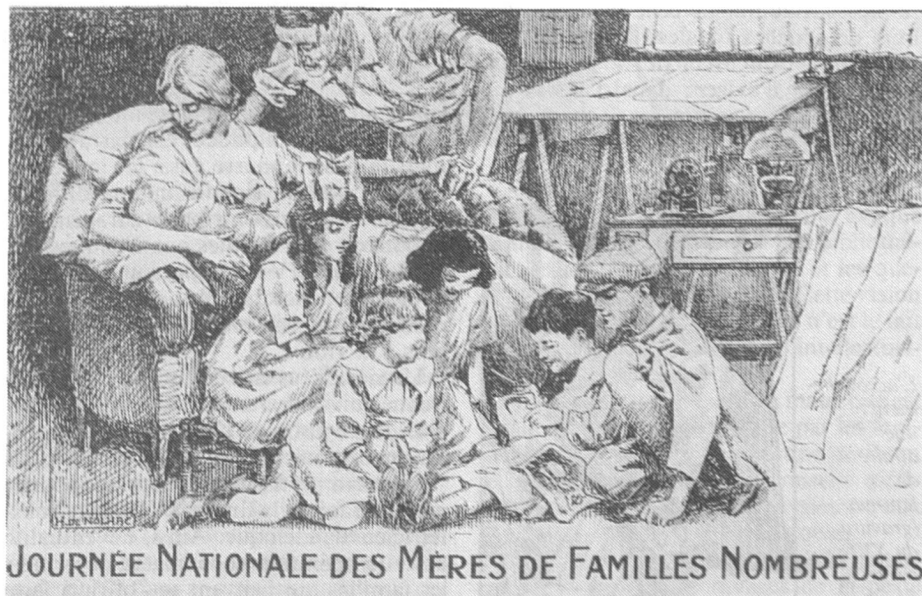
Carte postale de propagande à l'honneur des familles nombreuses... (non datée)

La prévention des naissances s'amorce très nettement au XIXe siècle déjà : les préservatifs existent depuis 1843, et le diaphragme vaginal depuis 1880. En outre, la méthode des rapports interrompus est tellement notoirement connue que l'Eglise prend position : d'abord avec compréhension, puis en la condamnant sévèrement,