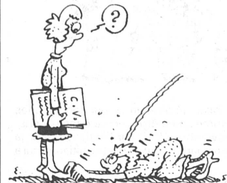
Ms. juin 1983