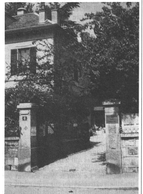
La Maison de la Femme, à Lausanne

Dans les intentions de Madeleine Moret, qui légua à son décès, en 1973, cette propriété à l'Union des Femmes de Lausanne, l'endroit devait devenir un centre de rencontre et une halte bienfaisante pour toutes celles qui s'y arrêteraient. Ce but est aujourd'hui partiellement atteint : plusieurs associations organisent régulièrement leurs séances dans la grande salle du dernier étage, qui contient aisément plus de 100 personnes. L'Union des Femmes y donne ses consultations juridiques gratui-