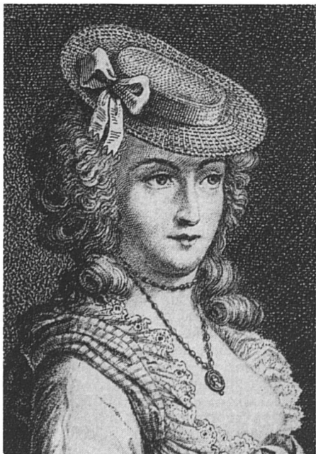
Mme d'Épinay, gravure anonyme

Les Emilie ne se sont jamais rencontrées. Elles appartenaient à des milieux qui ne se fréquentaient pas : Mme du Châtelet à la haute noblesse, Mme d'Épinay à la petite. Pourtant, le dernier amant de la première a été l'un des premiers de la seconde, et au