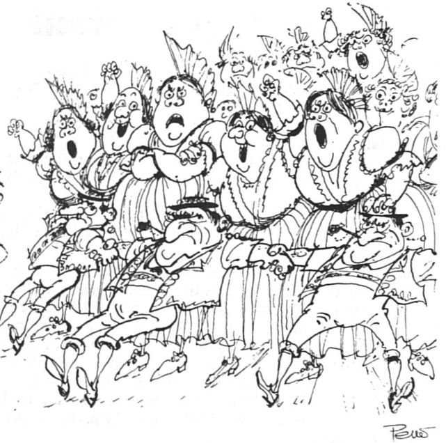
Basler Zeitung (29.9.83)