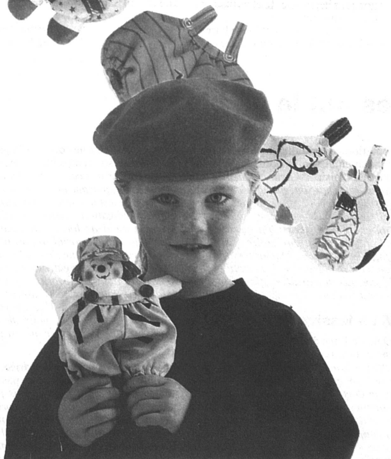
Un bricolage de « 100 idées »