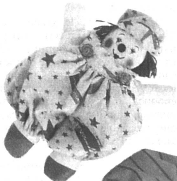
La garde-robe du petit clown... impossible à réaliser sans l'aide de maman