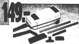
Aspirateur PHILIPS P 61, 800 W, complet avec accessoires. Garantie 1 an, 149.-

New Look pour « La Belle et la Bête »...