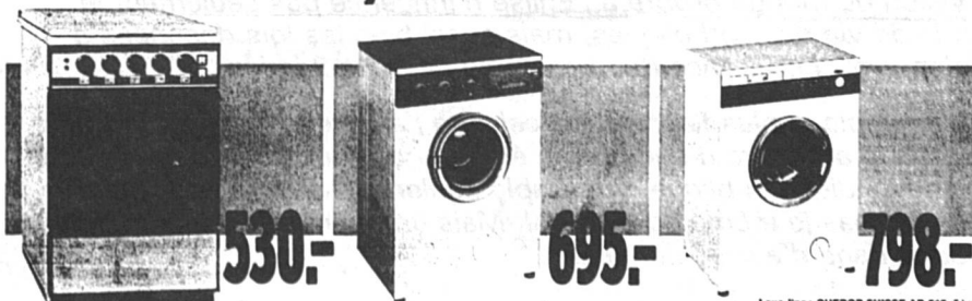
Cuvelière INDEBIT 122, 4 plateaux. Tourne-broche, tiroir, 360 ou 220 volts. Garantie 1 an, 530.-