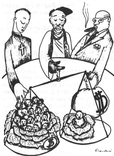
Dessin de Franchini, « Le Monde », 18-19 mars.

Pourquoi la planification familiale ne progresse-t-elle pas davantage? Les gouvernements sont responsables, car ils ont donné priorité au développement technique, mais il est évident que l'explosion démographique sape à la base tous les efforts pour lutter contre la pauvreté et qu'elle crée instabilité et violence. A cela il faut ajouter l'attitude tradi-