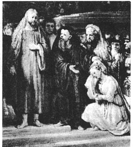
La femme adultère devant Jésus, Rembrandt, Londres, National Gallery (détail).

Soutenant l'initiative de ses membres féminins, le Conseil de paroisse de St-