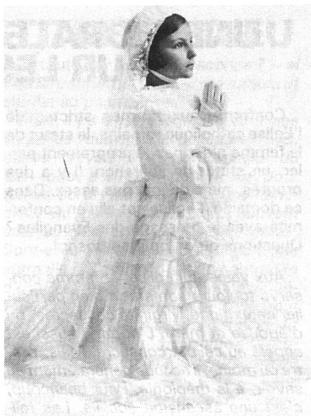
Une communiant des années 30 : promise à un destin de mère au foyer ou de vierge. Et aujourd'hui ?

Cette encyclique a été rédigée malgré les recommandations contraires de la commission d'experts désignée par Paul VI. Elle a d'emblée rencontré une forte op-