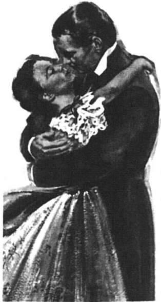
Les modes changent...