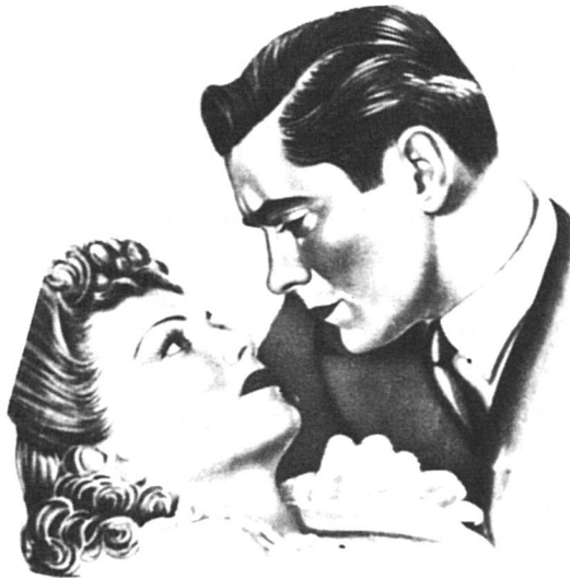
... le prince charmant...