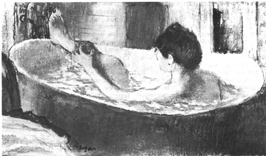
Femme s'épongeant dans sa baignoire, Paris, Le Louvre

Degas : le peintre de la femme en mouvement, le peintre de la femme au quotidien. Parce qu'il l'a représentée en train de se laver, en train de repasser, pensive, préoccupée ou concentrée à sa tâche, Degas a passé, et passe encore pour le peintre le plus misogyne de l'histoire de l'art. Ce qui en dit long sur la représentation socialement acceptable du corps féminin. Dans sa vision de la femme, Degas enfreint en effet un certain nombre de « règles » que l'on peut énumérer comme suit :