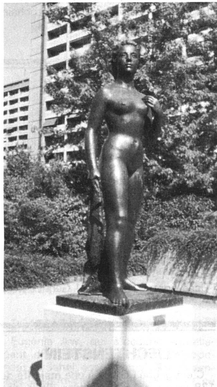
Henri König, « Jeunesse », 1974.

— Ne me dis pas que tu es toujours troublée par tes rondeurs mal placées ? Franchement, je te croyais plus libérée !