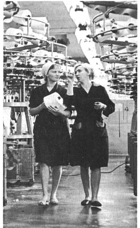
En URSS, 93 % des femmes travaillent ou étudient.

FS : Toutes ces mesures, si elles aident les femmes, n'incitent guère