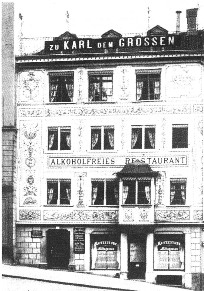
Karl der Große, Kirchgasse 14, le jour de son ouverture en 1898

En outre, il a d'emblée assuré une vraie formation professionnelle à son personnel et lui a proposé des loisirs éducatifs, leçons de gymnastique et de couture par exemple. Dès 1904, il a créé une caisse de retraite. Il a toujours été en avance sur son temps en ce qui concerne les conditions de travail, les congés, les vacan-